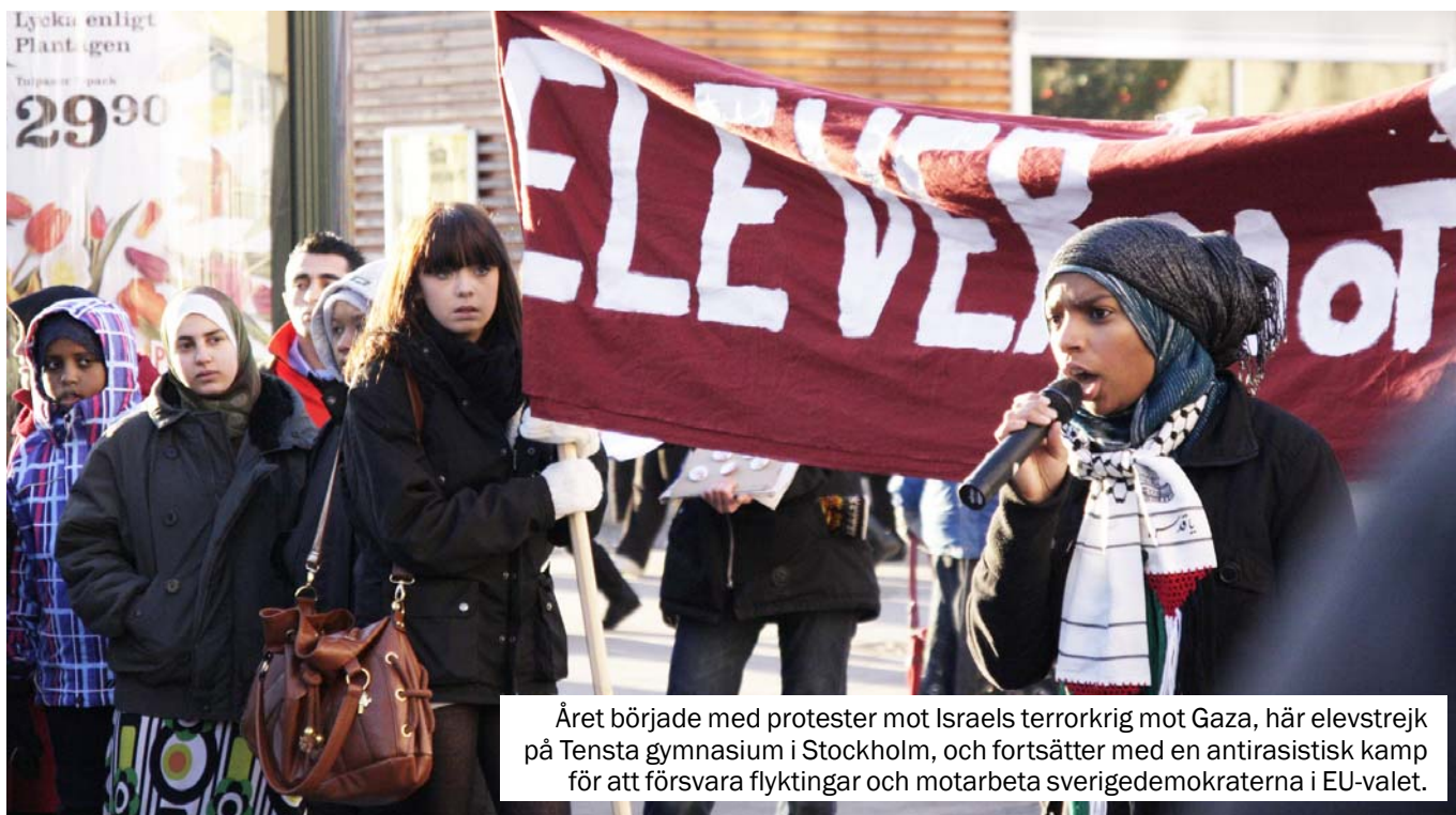
Året började med protester mot Israels terrorkrig mot Gaza, här elevstrejk på Tensta gymnasium i Stockholm, och fortsätter med en antirasistisk kamp för att försvara flyktingar och motarbeta sverigedemokraterna i EU-valet.