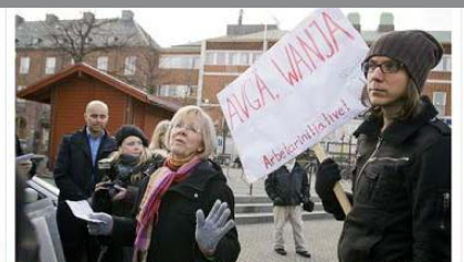
Många av medlemmarna visade öppet sitt missnöje när Wanja Lundby-Wedin idag talade på ett torg i Umeå.

Vid Volvos bolagsstämma i Göteborg den 31 mars protesterade ArbeterInitiativet och fackliga förtroendevalda från Volvo Lastvagnar mot miljardregnet över aktieägarna när tusentals arbetare sparkas.